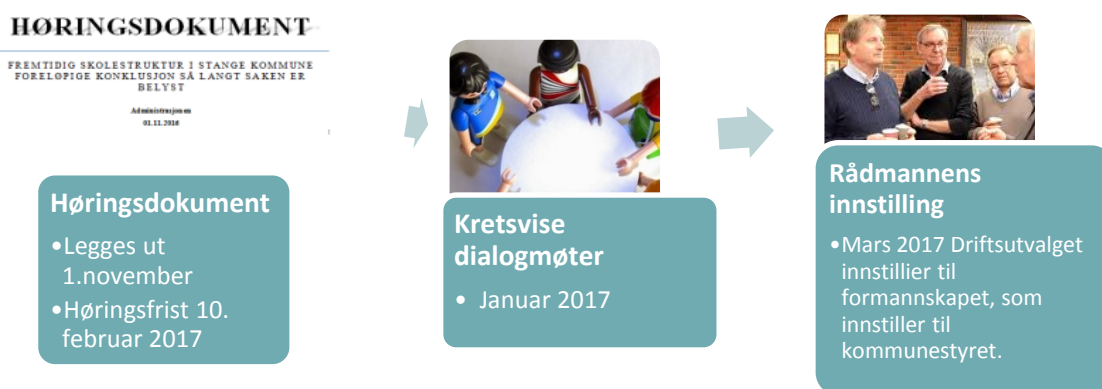
Figur 2: Framdriftsplan for fase 3

Dette dokumentet er rådmannens vurderinger og råd i forhold til framtidig skolestruktur, og representerer et grunnlag til den politiske behandlingen. Hensikt med høringen er å gi innspill til den politiske behandlingen av framtidig skolestruktur. Rådmannen foretar ingen vurdering av høringsinnspillene, men legger disse fram for politisk behandling. Endringer i dagens skolestruktur, vil måtte følges opp med egen sak vedrørende endringer i forskrift om skolekretsgrenser.