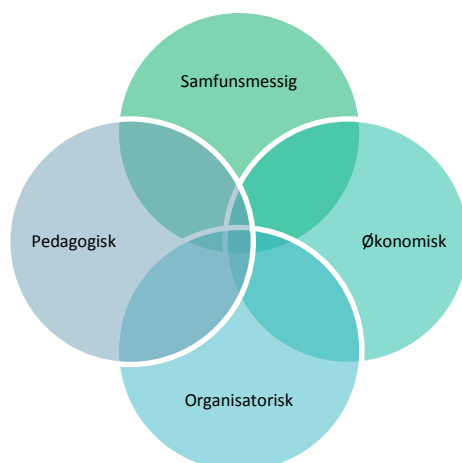
Figur 3: De fire perspektivene og relasjonen mellom disse