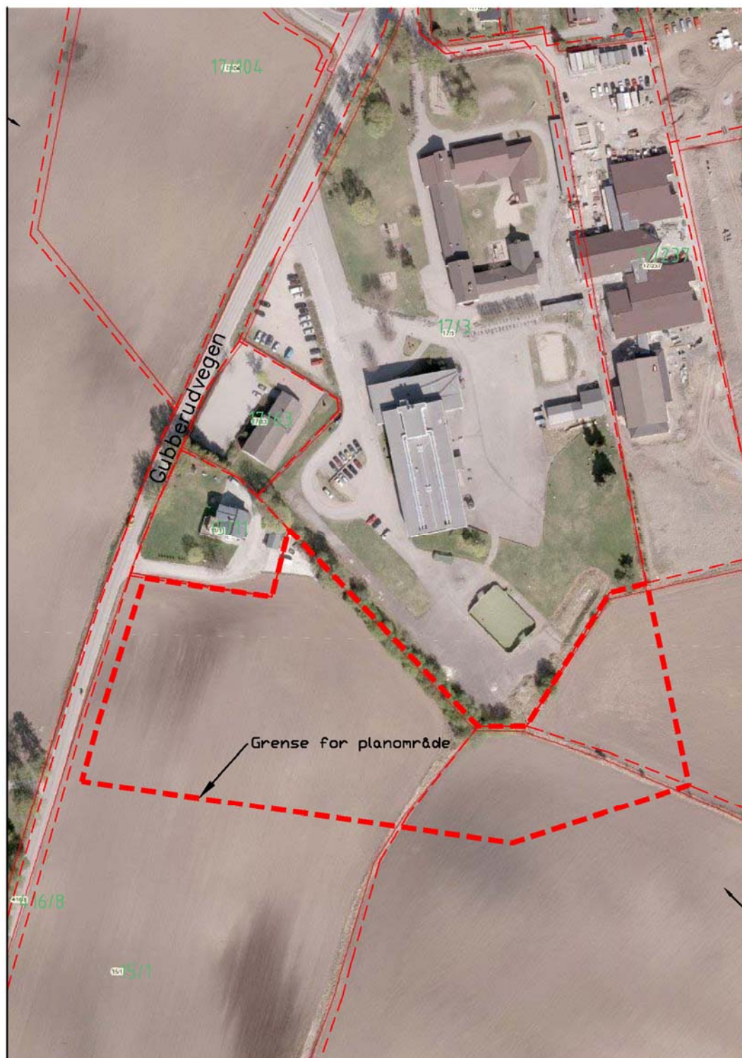
Bilde 1: Rød stiple linje for avgrensning av planområdet